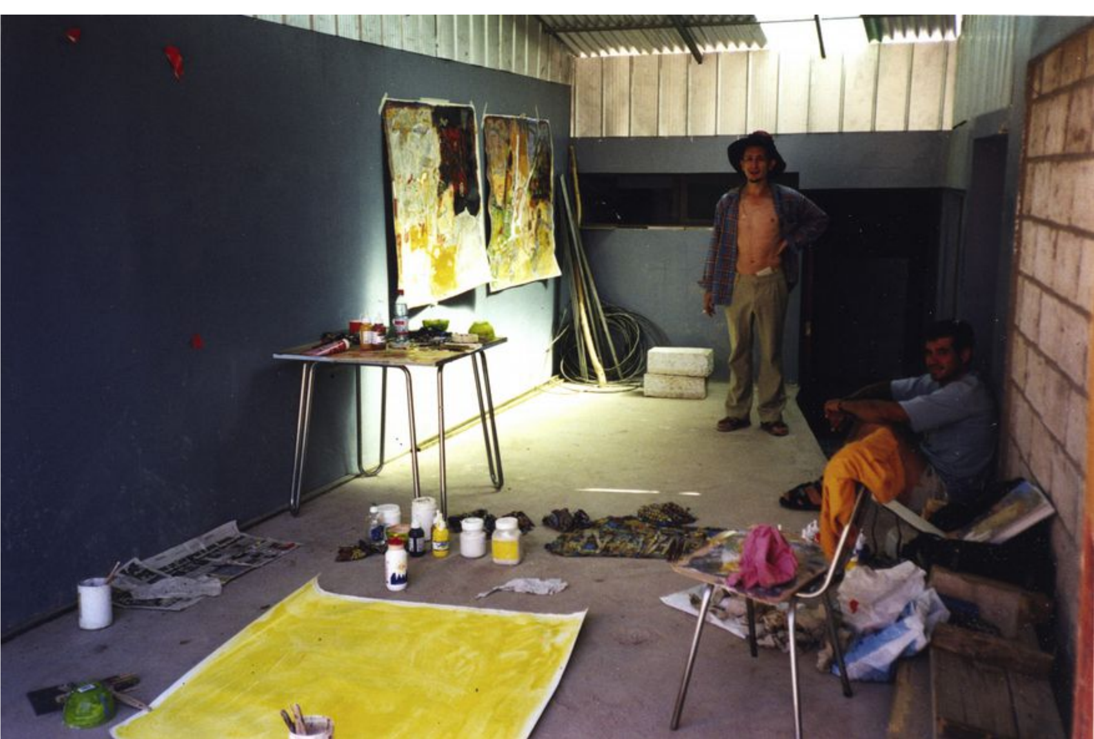
Voici mon atelier à Toconao, l'on m'avait cédé le garage de la camionnette .